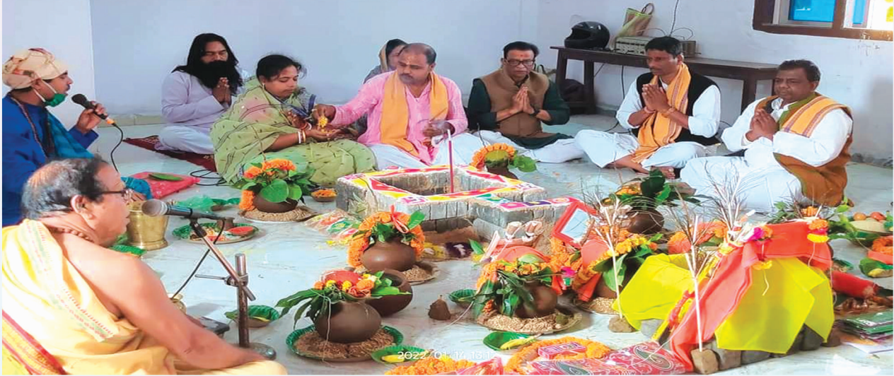
ଶିଶୁ ବାଚିକା ଭବନର ଉଦ୍ଘାଟନ, ସରସ୍ୱତୀ ଶିଶୁ ବିଦ୍ୟା ମନ୍ଦିର, ନୂଆବଜାର, ଭଦ୍ରକ