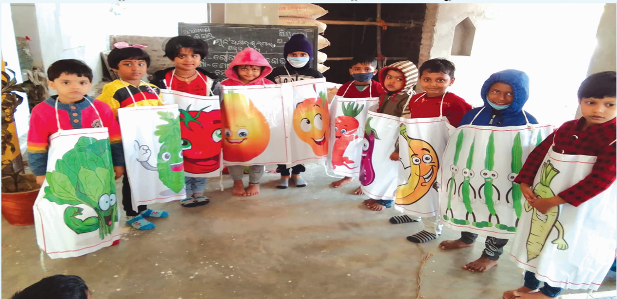
ଗ୍ରାମୀଣ ଶିକ୍ଷାରେ ଆମ ଶିଶୁ ବାଚିକା, ସରସ୍ୱତୀ ଶିଶୁ ବିଦ୍ୟା ମନ୍ଦିର, ନୂଆବଜାର, ଭଦ୍ରକ