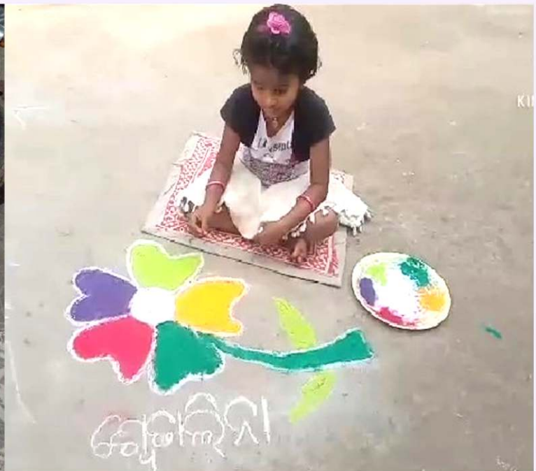
ଶ୍ୱେତାଲିନା ପ୍ରଧାନ, ଶିଶୁ ବୋଧ ସରସ୍ୱତୀ ଶିଶୁ ବିଦ୍ୟା ମନ୍ଦିର, ରାସୋଳ