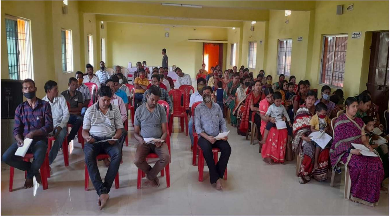
ସରସ୍ୱତୀ ଶିଶୁ ମନ୍ଦିର, ଧନୁପାଳୀ, ଘର ହିଁ ବିଦ୍ୟାଳୟ ପ୍ରକଳ୍ପ