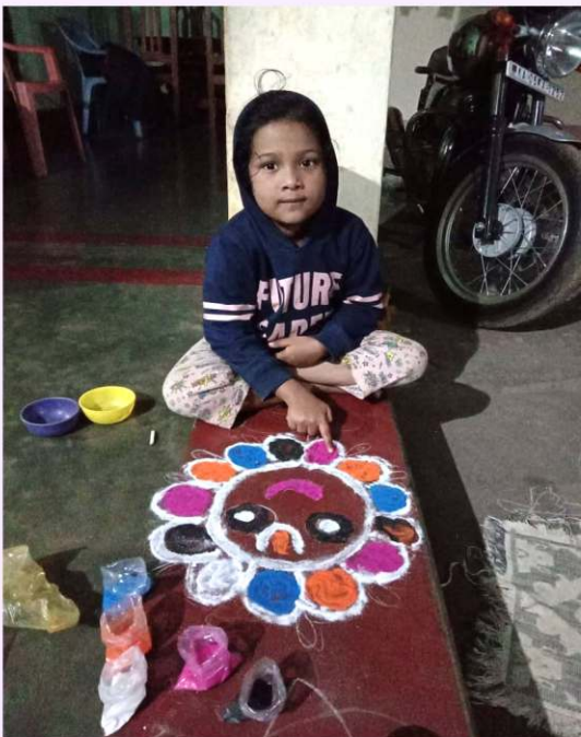
ଦିବ୍ୟାଂଶ ସର, ଶିଶୁ ବୋଧ ସରସ୍ୱତୀ ଶିଶୁ ବିଦ୍ୟା ମନ୍ଦିର, ରାସୋଳ