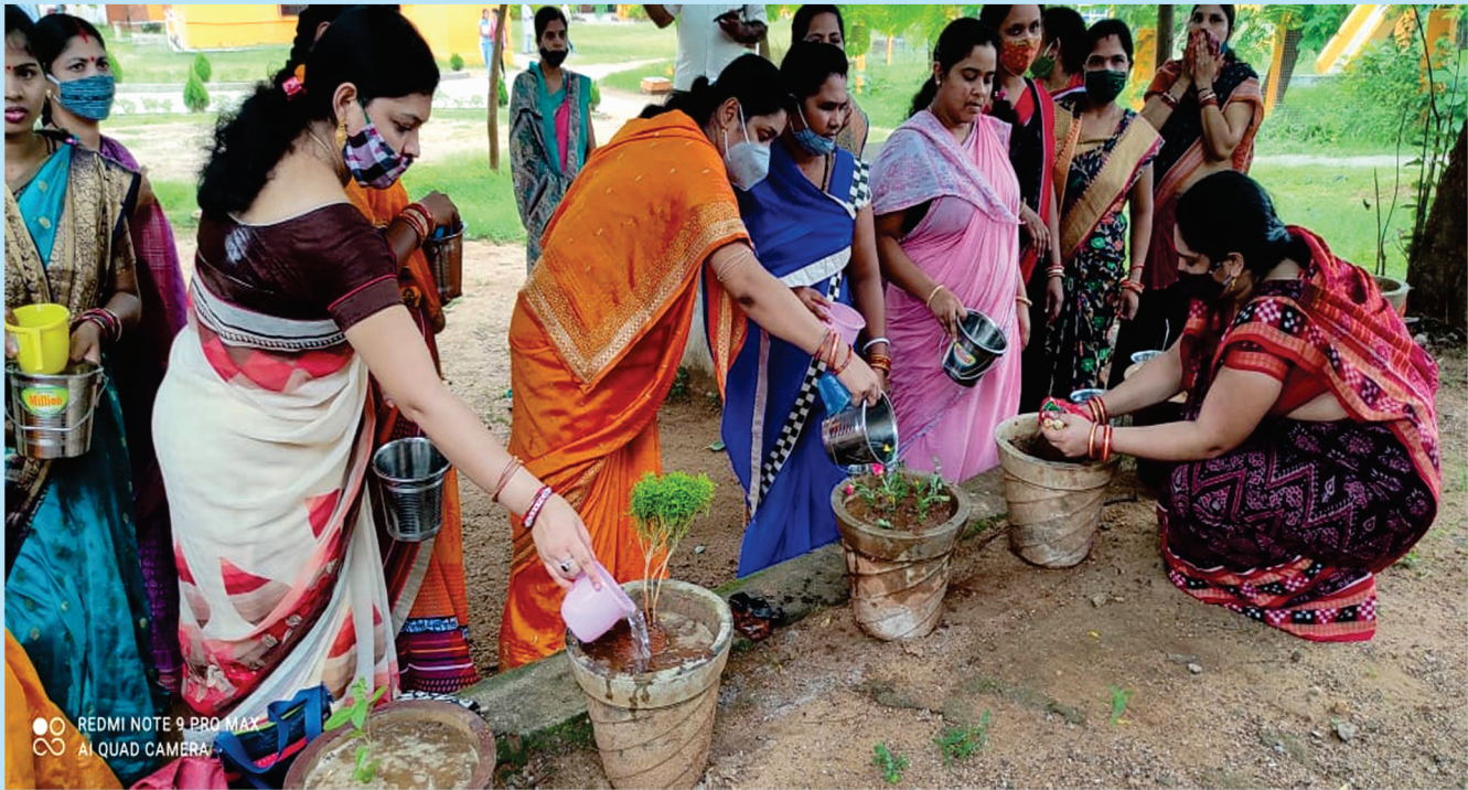
ମାତୃ କର୍ମଶାଳା (ବଗିଚା କାମ) ସ.ଶି.ବି.ମ, କଲେଜ ଛକ, ବଲାଙ୍ଗୀର