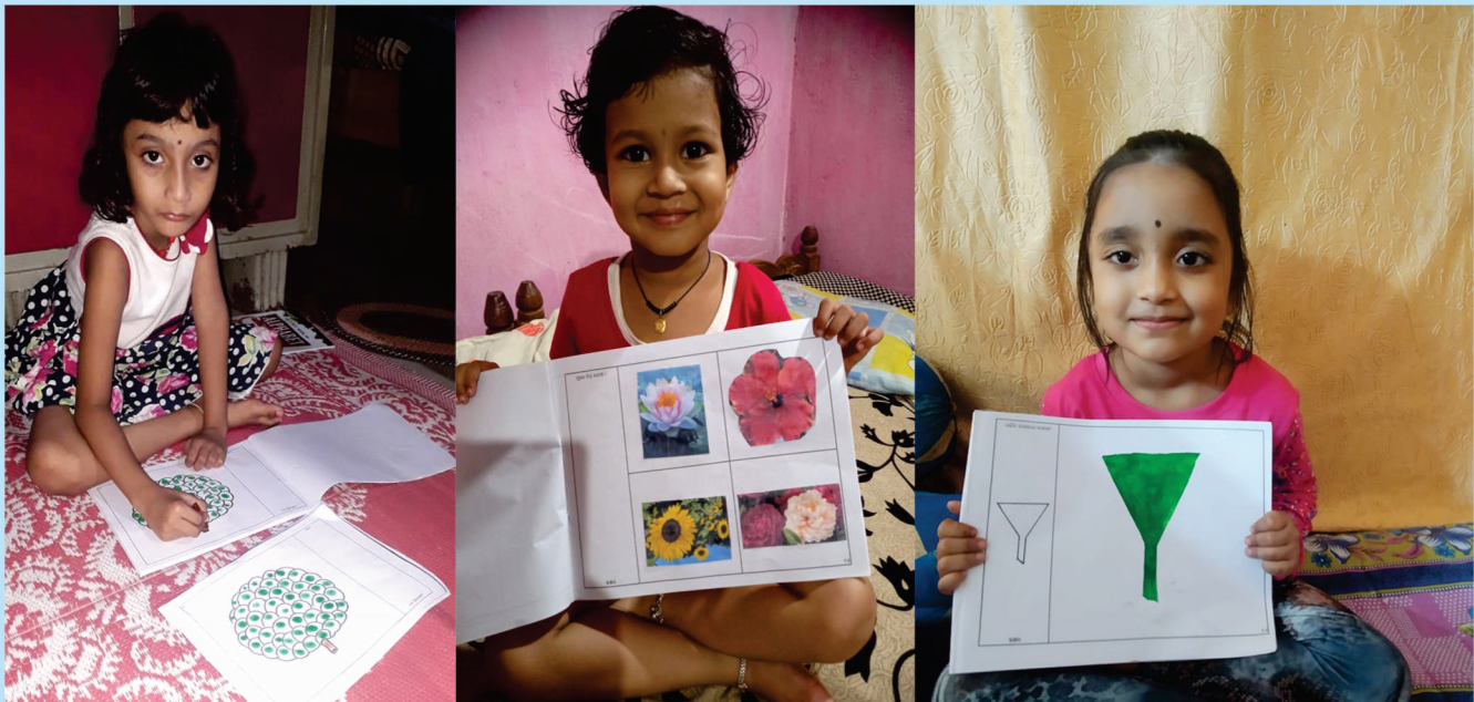
କ୍ରିୟାକଳାପ ପୁସ୍ତିକାରେ ରଙ୍ଗ କାମ ଓ କାଗଜରେ କାମ, ସରସ୍ୱତୀ ଶିଶୁ ବିଦ୍ୟା ମନ୍ଦିର, କଲେଜ ଛକ, ବଲାଙ୍ଗୀର