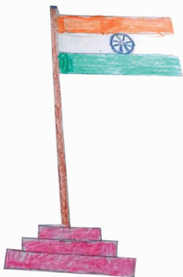
ରୁଦ୍ର ନାରାୟଣ ସାହୁ