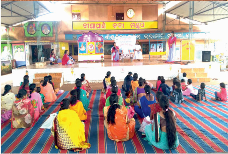
ସରସ୍ୱତୀ ଶିଶୁ ବିଦ୍ୟା ମନ୍ଦିର, ଭଦ୍ରାସାହିର ମାତୃ ସମିଳନୀ, ବିଦ୍ୟାରମ୍ଭ ସଂସ୍କାର ଓ ଜନ୍ମାଷ୍ଟମୀ କାର୍ଯ୍ୟକ୍ରମ ।