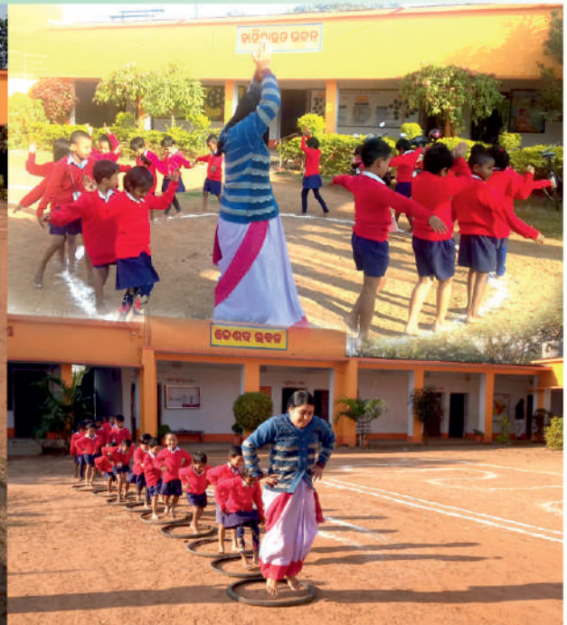
ସରସ୍ୱତୀ ଶିଶୁ ବିଦ୍ୟା ମନ୍ଦିର, ରାସୋଳ