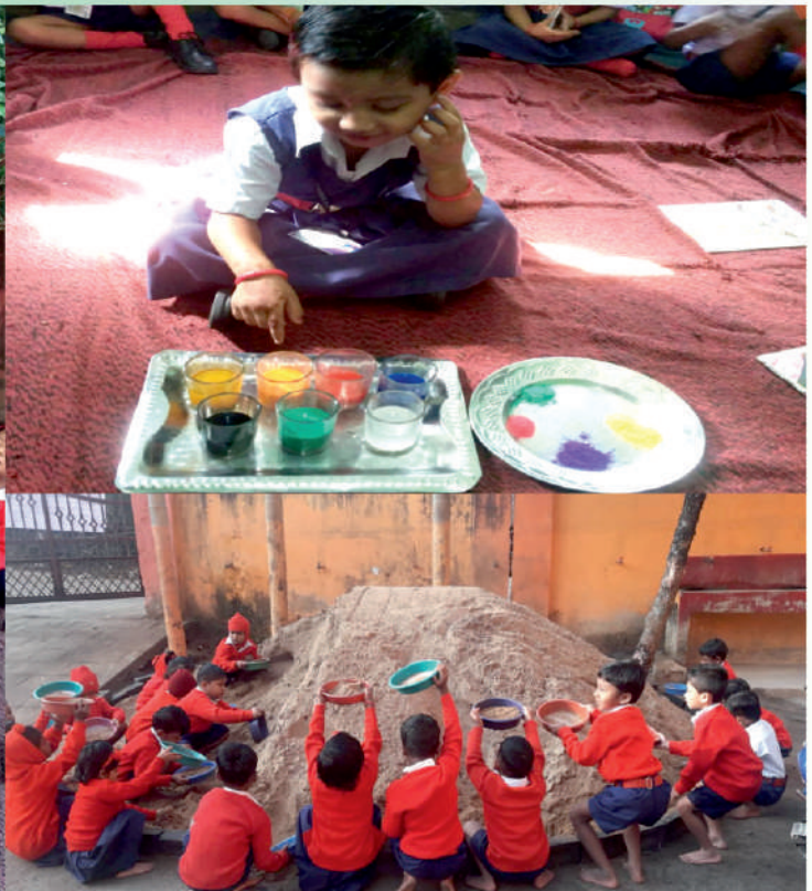
ସରସ୍ୱତୀ ଶିଶୁ ବିଦ୍ୟା ମନ୍ଦିର, କଦମପଡ଼ା ବଲାଙ୍ଗୀର