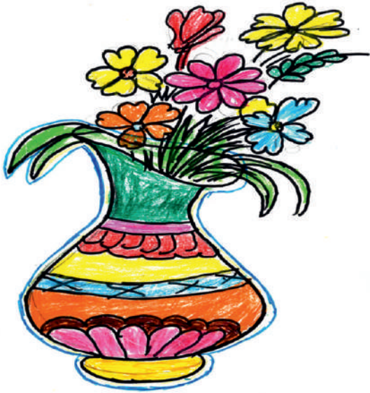
କାଜଲ କ୍ରିଷ୍ଣା ଘଡ଼େଇ